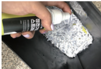
정전기방지 스프레이 100ml