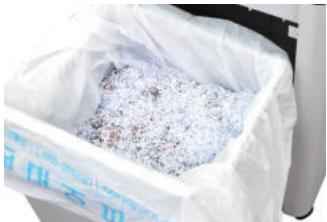
규격: 소형 | 크기: 650 X 550mm